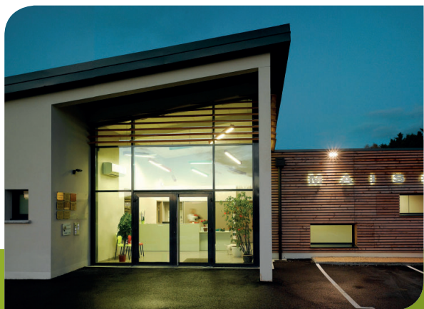
La Maison de Santé de Sancerre

J'ai intégré le Comité de Pilotage et représenté la MSA en tant qu'administrateur et ainsi appuyer sa présence dans ce projet. //