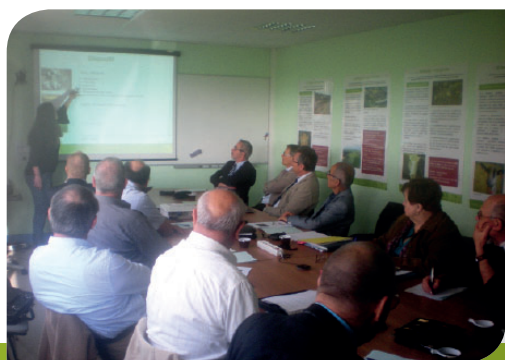
Réunion sur le terrain du Comité Départemental du Cher

// Un adhérent MSA m'a contacté pour avoir des informations suite à un accident du travail. J'ai pu l'orienter vers l'interlocuteur MSA qui était le plus à même pour l'aider dans ses démarches et répondre à ses interrogations. C'est une aide de proximité que nous pouvons apporter à nos adhérents. //