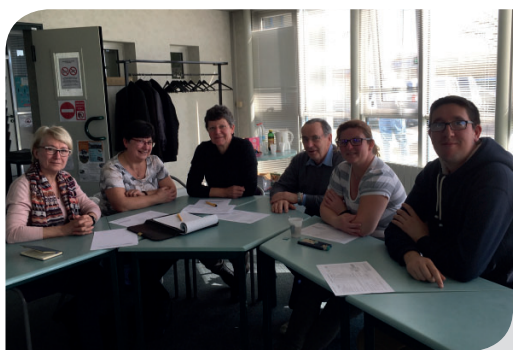
AG de l'échelon local Gâtinais Puisaye

Dans ce rôle au sein des structures, j'informe des différentes actions et interventions possibles de la MSA et participe aux projets de leurs structures. //