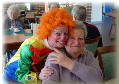
Le mardi gras 2010, à La Guinguette

Comme dans toutes les familles, fêtes et anniversaires sont l'occasion de passer un bon moment. Et puis il y a toutes les activités proposées !