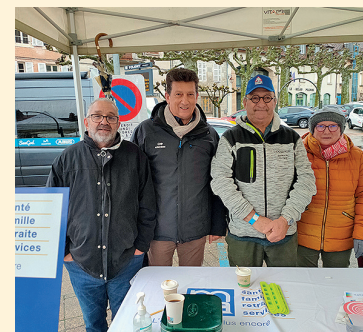
Des délégués de la MSA Franche-Comté mobilisés sur le stand MSA du Tour du Jura.