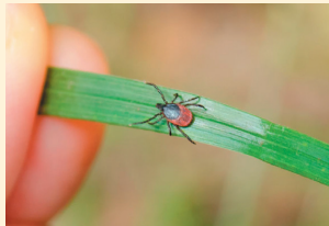
la tique, petite mais pas toujours inoffensive.

Pour limiter la prolifération des tiques, il faut faucher, tondre court et fréquemment. Avant de partir en promenade, à la chasse, cueillir des champignons... habillez-vous avec des vêtements longs couvrant les bras