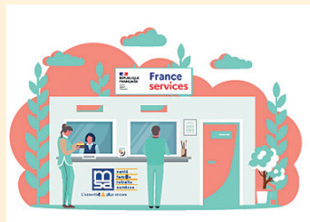
■ La MSA est partenaire de nouvelles structures © CCMISA.

Piloté par le ministère de la Cohésion des territoires et des Relations avec les collectivités territoriales via l'Agence