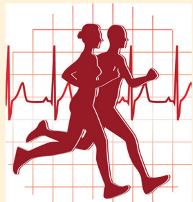
Agrisport, un programme personnalisé adapté à vos besoins.

besoins des participants. Le cycle commence par un ensemble de tests qui permettront d'évaluer les effets de l'action sur les aspects physiques, sociaux et psychologiques des participants.