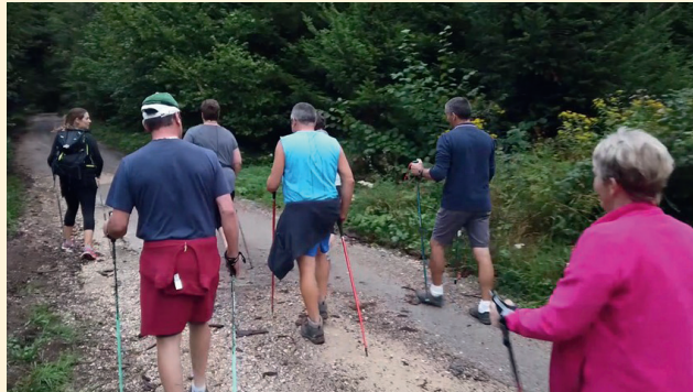
Agri'Sport, un programme personnalisé adapté à vos besoins.

L'objectif est de créer un programme personnalisé pour chacun des participants, afin de répondre au mieux à leurs attentes et leurs besoins.