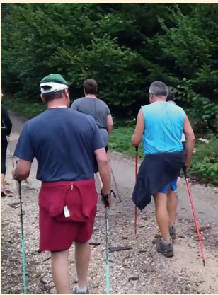
Agri'Sport, un programme personnalisé adapté à vos besoins.